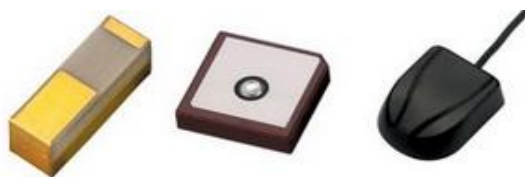
Рисунок 1 – Варианты конструктивного исполнения GPS-антенн (слева на право): чип-антенна, патч-антенна и внешне законченная антенна [1]

На рисунке 1 представлены изображения всех трех вариантов конструктивного исполнения антенн: