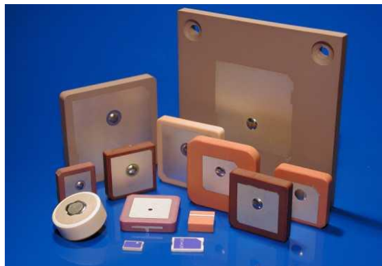
Рисунок 2 – Конструкция патч-антенн

Патч-антенна – тип узкополосной антенны, состоящей из плоского металлического лепестка, закрепленного на некотором расстоянии параллельно металлической пластине. Обычно эту конструкцию заключают в пластиковый радиопрозрачный кожух. Пример конструкции патч-антенн представлен на рисунке 2.