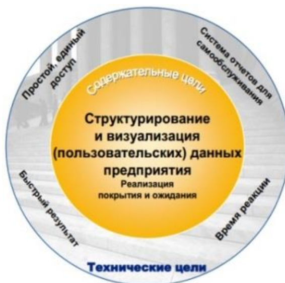
Рисунок 2 – Цели SAP BW

Однако для использования системы SAP BI в бизнес-процессах необходима закупка дорогостоящих лицензий, которые могут быть неподъемны для малого и среднего бизнеса. Но для просмотра пользователями возможностей использования системы в отраслях бизнеса возможно создание демонстрационной версии. Она будет содержать формы ввода для клиентов и несколько шаблонов отчетов, сделанных в выбранной программе, например SAP Lumira Designer или SAP BusinessObjects Web Intelligence. Отчёты [3]. Это позволит наглядно продемонстрировать все возможности SAP системы и выбрать наиболее подходящую для бизнес-процесса.