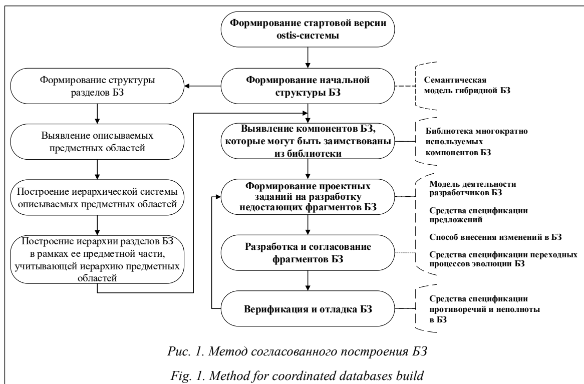
Рис. 1. Метод согласованного построения БЗ

Предложенные модели, метод и инструментальные средства были использованы при разработке прототипа системы автоматизации предприятий рецептурного производства [20],