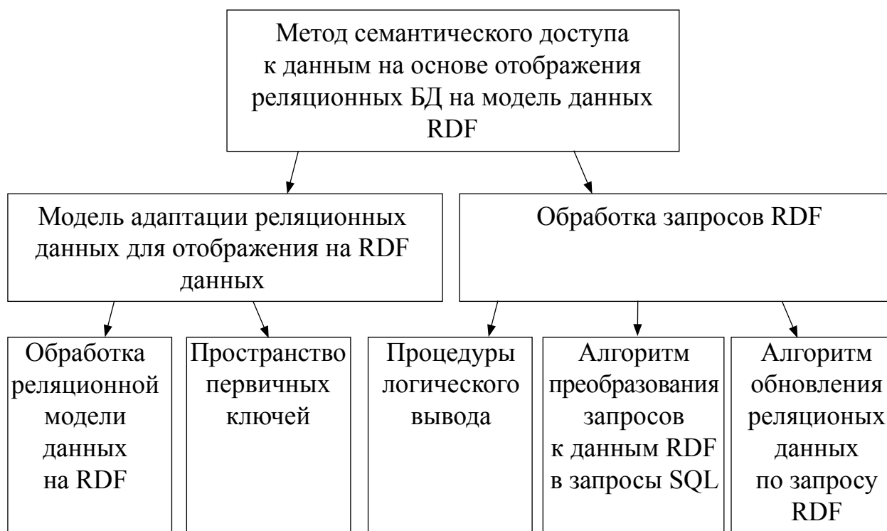
Рисунок 1 – Структура метода семантического доступа к данным на основе отображения РБД на модель RDF

На рисунке 1 представлена структура разработанного метода семантического доступа к данным на основе отображения реляционных БД на модель данных RDF.