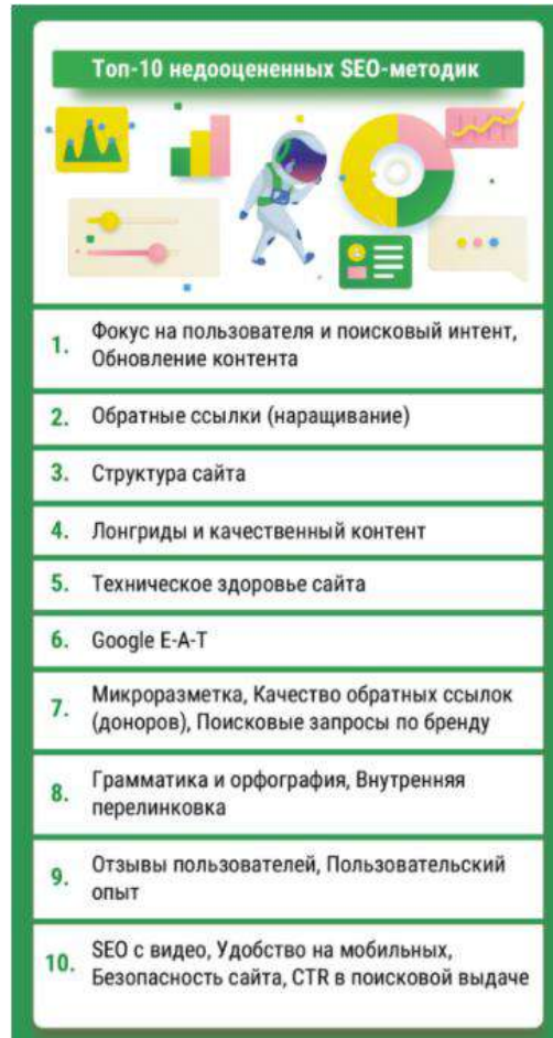
Рисунок 2 – Методы и тенденции SEO-оптимизации

Данная исследовательская работа поможет определить какое количество органического трафика (рисунок 1) приходит на веб-ресурс, какие достигаются макро- и микроконверсии (рисунок 2), которые должны учитываться при построении дальнейшей работы над веб-ресурсом [2].