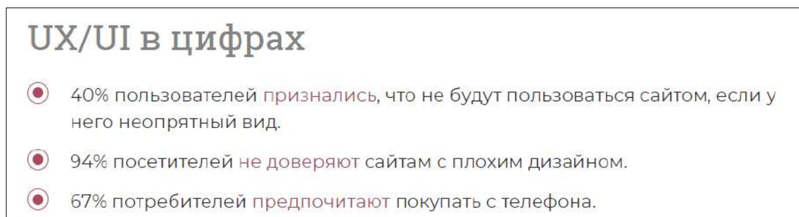
Рисунок 4 – UX/UI – дизайн в цифрах

Заключение. Работа с Usability поможет пользователю быстро ориентироваться в веб-ресурсе и сделать его запоминающимся, для этого необходимо использовать принципы UX/UI дизайна. UX – это процесс, а UI – это инструмент. У UI/UX -дизайн одна цель – сделать взаимодействие пользователя с веб-ресурсом удобным, приятным и запоминающимся (рисунок 4). К способам улучшения UX/UI : унификация стиля и использование единой цветовой гаммы, выделение наиболее важных элементов более заметным цветом, добавление текста в формы для заполнения, чтобы было проще для понимания, использование одного шрифта, единый стиль у иконок и логотипов.