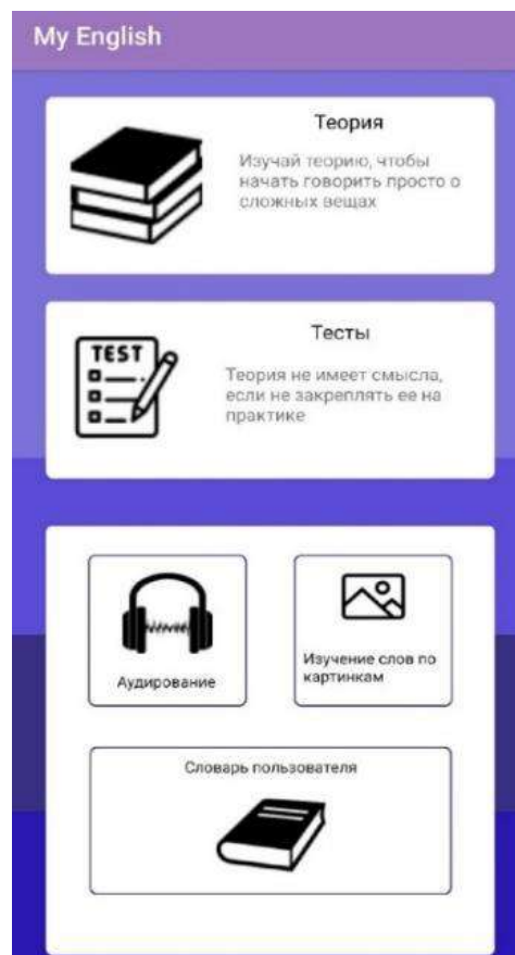
Рисунок 2 – Главное меню приложения

Результаты сравнительного анализа аналогов разработанного приложения, позволяют говорить о таких его преимуществах, как наличие достаточно широкого спектра функций: изучение слов по картинкам, работа со словарем, аудирование, изучение теории, закрепление материала посредством тестовых заданий. В отличие от большинства аналогов,