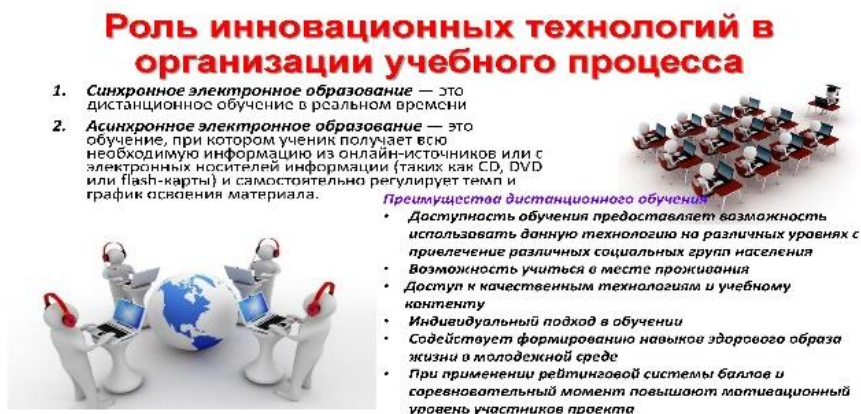
Рисунок 3 - Роль инновационных технологий в организации учебного процесса.

Показателями нового качества образовательного процесса могут выступать следующие характеристики: новые знания, формирование основных компетенций у курсантов (студентов), повышение уровня их личностного развития; отсутствие отрицательных эффектов и последствий (перегрузки, утомление, ухудшение здоровья, психические расстройства, дефицит учебной мотивации и пр.); повышение профессиональной компетентности офицеров-педагогов и их отношения к работе; рост престижа образовательного учреждения, выражающийся в притоке обучаемых и преподавателей и др.