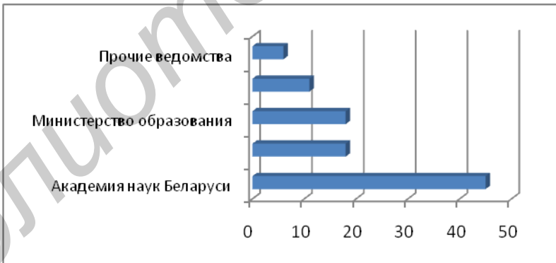
Рисунок Т.2 – Распределение общих расходов на научно-техническую деятельность по министерствам и ведомствам