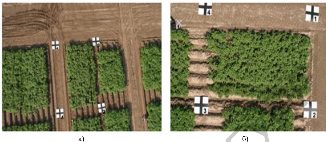
Рис. 2. Примеры исходных аэрофотоснимков с высоты: а) 100 метров; б) 50 метров

зования глобального позиционирования, но и вычислять пространственное разрешение снимков – размер наименьшей структуры на сфотографированной поверхности, наблюдаемой на изображении, а, следовательно, и масштаб карты.