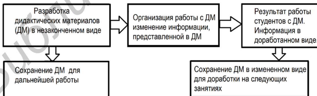
Рис. 2. Этапы работы с дидактическими материалами

Созданные преподавателем дидактические материалы для интерактивной доски могут содержать информацию в незавершенном виде, но в педагогическом сценарии предусматриваются варианты изменения этой информации в процессе коллективной познавательной деятельности студентов во время занятия. В дальнейшем под руководством преподавателя информация изменяется, дорабатывается, приобретает законченный вид и сохраняется в новом виде (рис. 2).