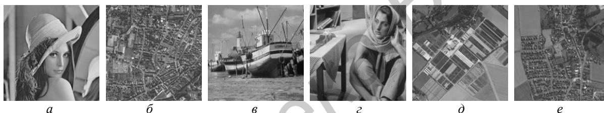
Рис. 2. Тестовые изображения: a – Lena 512×512 пикселей; б – City 512×512 пикселей; в – Boat 512×512 пикселей; г – Barbara 512×512 пикселей; д – Fields 1024×1024 пикселей; е – Town 2048×2048 пикселей

В табл. 2 и 3 для рассматриваемых алгоритмов сегментации и шести тестовых изображений приведены число сегментов и разности площадей сегментов по сравнению с базовым алгоритмом, позволяющие оценить точность сегментации.