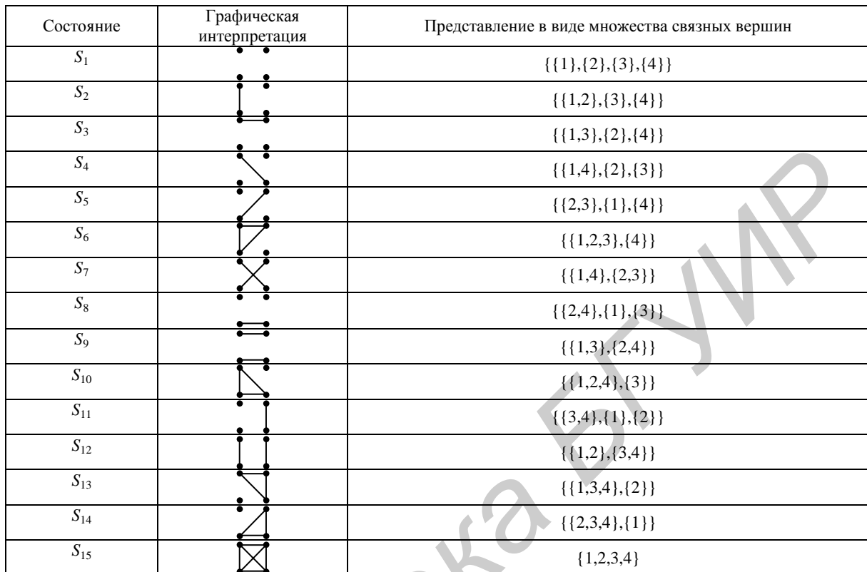
Таблица. Описание состояний надежности системы-четырёхполюсника

Например, состояние S_2 характеризует состояние системы-четырёхполюсника, у которой функционирует компонент K_1 . Соответственно в графе присутствует связь между вершинами N_1 и N_2 . Состояние S_6 определяет состояние системы, у которой функционируют компоненты K_1, K_2, K_4 , что означает наличие связи в графе между узлами N_1, N_2, N_3 \in N . Аналогично описываются все состояния, соответствующие различным вариантам функционирования системы.