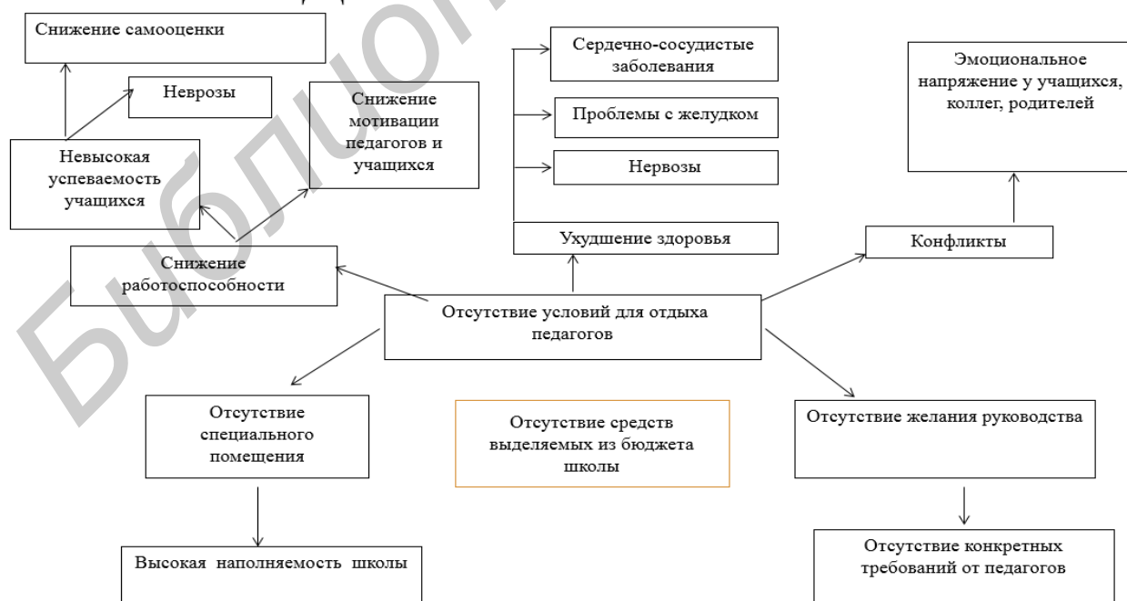
Рисунок 1 – Дерево проблем