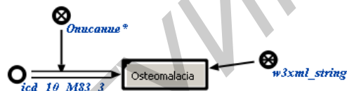
Рисунок 3 – SCg-код результата трансляции триплета с типизированным литералом.

icd_10_M83_3 => icd_10_has_Description : [Osteomalacia] (* <- w3xml_string;; *);;