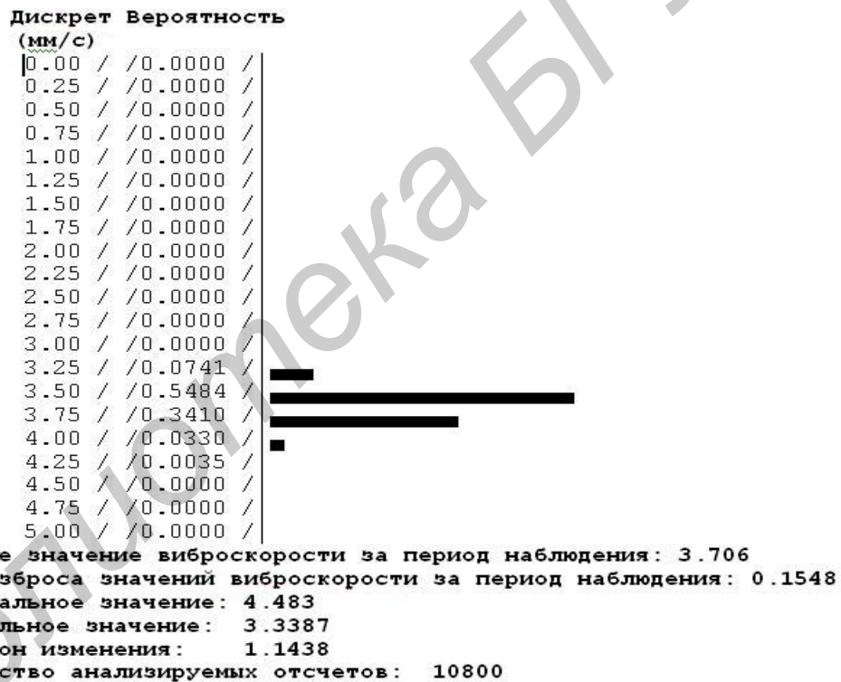
Рис. 3. Результаты обработки суточного временного тренда СКЗ виброскорости подшипника генератора при его нормальной работе

Статистическая обработка данных может быть выполнена с помощью достаточно простого программного средства. На рис. 3 показан пример такой обработки, в результате которой получена гистограмма распределения СКЗ виброскорости по уровню и численные значения, определяющие отличительные особенности его изменения. Эти вычисленные значения можно принять в качестве вектора информативно-значимых параметров для системы поддержки принятия решений по оценке изменения технического состояния контролируемого объекта.