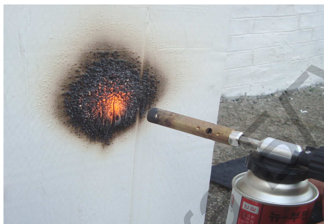
Рисунок 1. – Процесс испытания огнестойкости образца № 1

Изготовленные образцы композиционных красок наносились на целлюлозные подложки. Исследование огнестойкости образцов проводилось в соответствии с требованиями [7]. При этом целлюлозные подложки, на которые были нанесены образцы изготовленных красок, закреплялись в вертикальном положении на металлической раме посредством держателей, затем осуществлялось воздействие на их поверхность открытого пламени. Источником пламени являлась портативная газовоздушная техническая горелка. Расстояние от сопла горелки до поверхности подложки, на которую нанесены краски, составляло 10 \pm 1 мм (рис. 1).