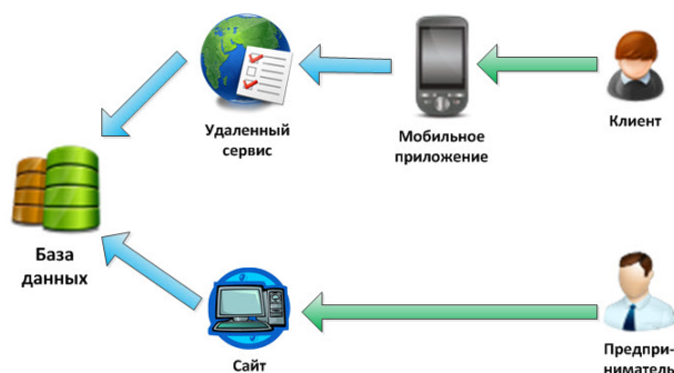
Рис. 1. Диаграмма взаимодействия компонентов системы

На рис. 1 показано взаимодействие между четырьмя основными компонентами системы, среди которых есть как веб, так и мобильные части.