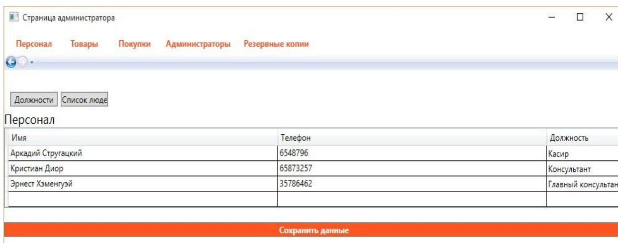
Рисунок 2 – Страница администратора

Информационная система магазина компьютеров и комплектующих реализуется в виде клиентского приложения. На страницах этого приложения должна отображаться информация имеющихся товаров (для покупателей), совершённых покупках, персонале (для администратора). Для создания и поддержки данных приложения необходима система управления, которая позволит за короткий промежуток времени произвести изменения или добавить новые данные. Поэтому для данного ресурса была реализована система управления написанная на языке программирования C# с использованием языка гипертекстовой разметки XAML (англ. eXtensible Application Markup Language ) и базы данных MS SQL.