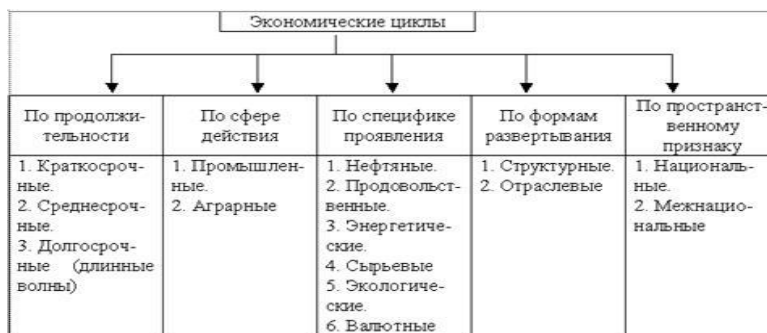
Рисунок 2. Специфика экономических циклов

Экономические циклы охватывают почти все области народного хозяйства и имеют самые разные отличительные особенности.