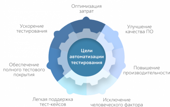
Рис. 1 – Цели автоматизированного тестирования

Автоматизированное тестирование программного обеспечения стало неотъемлемой частью процесса разработки ПО. Это является одним из мировых трендов для компаний, занимающихся ИТ-инженерией. Использование автоматизированного тестирования позволяет оптимизировать процесс разработки программного продукта основные цели данного подхода представлены на рисунке 1.