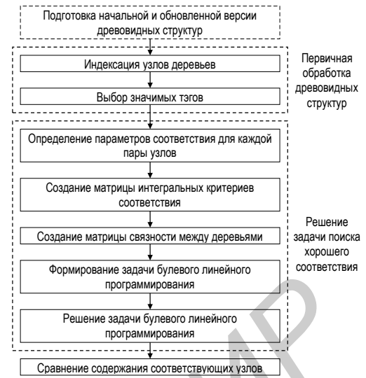
Рисунок 1 – Блок-схема метода детектирования изменений между древовидными структурами

Приведенный метод детектирования изменений можно описать в виде следующей блок-схемы, представленной на рис. 1.