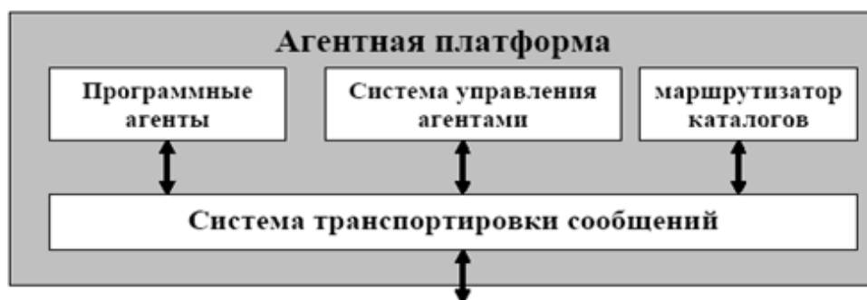
Рис. 3. FIPA-модель агентной платформы

Система управления агентами (СУА) представляет собой агента, который осуществляет контроль доступа и использования агентной платформы. В каждой агентной платформе присутствует одна СУА, которая предоставляет сервис жизненного цикла программных агентов и их реестр с идентификаторами, а также содержит состояния каждого программного агента. Маршрутизатором каталога является программный агент, который обеспечивает направление запросов в другие агентные платформы. Система транспортировки сообщений, или канал коммуникации агентов, является программным компонентом для управления потоками сообщений с агентной платформой, содержащих также сообщения от/во внешние платформы [3].