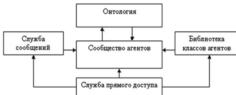
Рис. 2. Модель ядра мультиагентной системы

Общая методология восходящего эволюционного проектирования МАС может быть представлена цепочкой: {среда – функции МАС – роли агентов – отношения между агентами – базовые структуры МАС – модификации}, и включает следующие этапы: формулирование назначения (цели разработки) МАС; определение основных и вспомогательных функций агентов в МАС; уточнение состава агентов и распределение функций между агентами, выбор архитектуры агентов; выделение базовых взаимосвязей (отношений) между агентами в МАС; определение возможных действий (операций) агентов; анализ реальных текущих или предполагаемых изменений внешней среды [2].