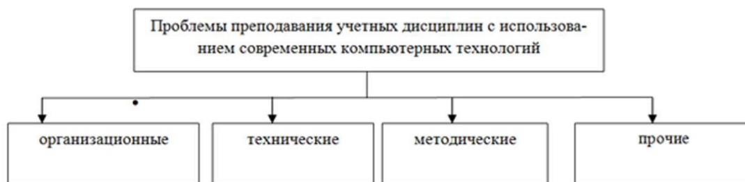
Рисунок 4 – Проблемы преподавания учетных дисциплин с использованием современных компьютерных технологий

Решение указанных проблем при преподавании учетных дисциплин в условиях интеграции с компьютерной обработкой учетно-аналитической информации по нашему мнению, позволяет активизировать образовательный процесс, стимулировать активность обучающихся.