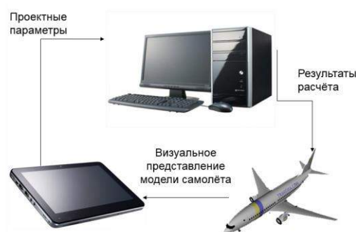
Рисунок 3 – удалённое управление САПР

Удалённый доступ к интерфейсу системы реализуется с целью упрощения взаимодействия пользователя с системой проектирования, повышения доступности благодаря возможности доступа с мобильных устройств (планшетных компьютеров и телефонов). На рисунке 3 изображена схема удаленного управления САПР [Кои, 2010].