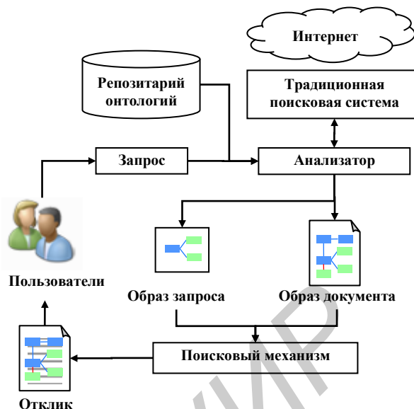
Рисунок 2 – Общая схема работы поисковой системы

Основная особенность предлагаемого подхода – использование репозитория онтологий на этапах преобразования запроса и документа. Откликом является структурированный документ, т.е. документ, в котором выделены понятия онтологий.