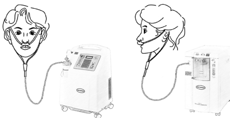
Рис. 2. Применение низкопоточной назальной канюли с концентратором кислорода «Оксимед» Fig. 2. The use of a low-flow nasal cannula with an oxygen concentrator “Oxymed”

В настоящее время при проведении длительной кислородной терапии применение кислородных концентраторов в качестве источника кислорода представляется наиболее оптимальным. Концентраторы кислорода обеспечивают получение кислородсодержащей смеси с объемной долей кислорода до 95 % непосредственно из окружающего воздуха [1]. Доставка кислорода пациенту может осуществляться посредством низкопоточной назальной канюли, высокопоточной лицевой маски с увлажнением, простой лицевой маски, маски с резервуаром, маски Вентури и т. д. В случае длительной кислородной терапии наиболее эффективным является использование низкопоточной назальной канюли (рис. 2).