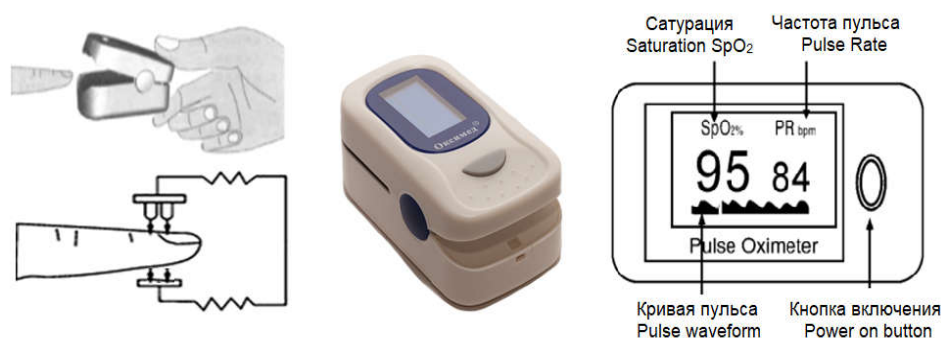
Рис. 1. Портативный пульсоксиметр «Оксимед» Fig. 1. Pulse oximeter “Oxymed”

Одним из наиболее практичных методов диагностики дыхательной недостаточности является неинвазивное измерение насыщения (сатурации) гемоглобина артериальной крови кислородом ( SpO_2 ) посредством пульсоксиметрии. Такая возможность обусловлена корреляцией показателя SpO_2 с показателем P_{aO_2} . Значение P_{aO_2} в норме должно быть в диапазоне 80–100 мм рт. ст. Данному диапазону соответствует диапазон нормы SpO_2 96–100 %. В настоящее время значение SpO_2 определяют с помощью портативного пульсоксиметра, устанавливаемого, как правило, на пальце (рис. 1).