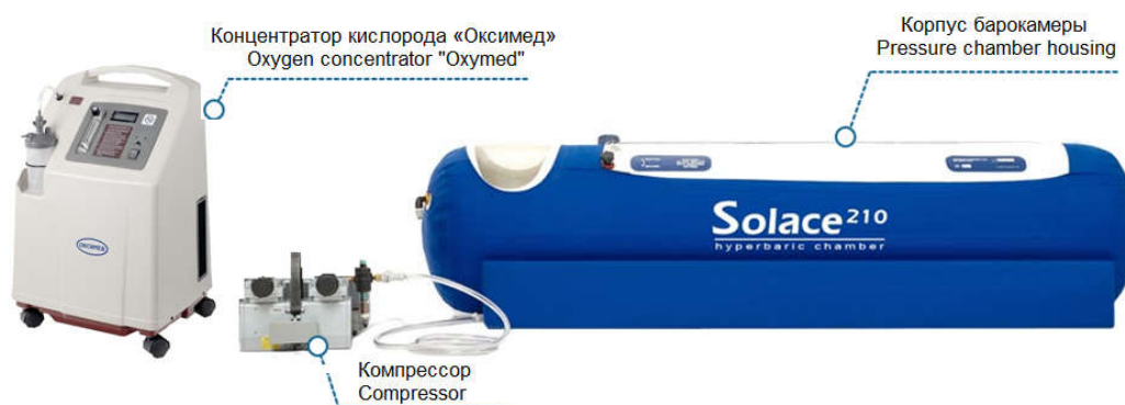
Рис. 3. Применение портативной барокамеры с концентратором кислорода «Оксимед» Fig. 3. The use of a portable pressure chamber with an oxygen concentrator "Oxymed"

Следует отметить возможность проведения кислородной терапии в портативной барокамере, обеспечивающей небольшое избыточное давление до 1,15 АТА. В этом случае в качестве источника кислорода также целесообразно использовать кислородный концентратор (рис. 3), который посредством назальной канюли подает кислородсодержащую смесь пациенту, находящемуся внутри портативной барокамеры. Возможен вариант подключения концентратора кислорода к корпусу барокамеры и создания внутри нее повышенной концентрации кислорода до 35 %. В таком случае назальная канюля не требуется.