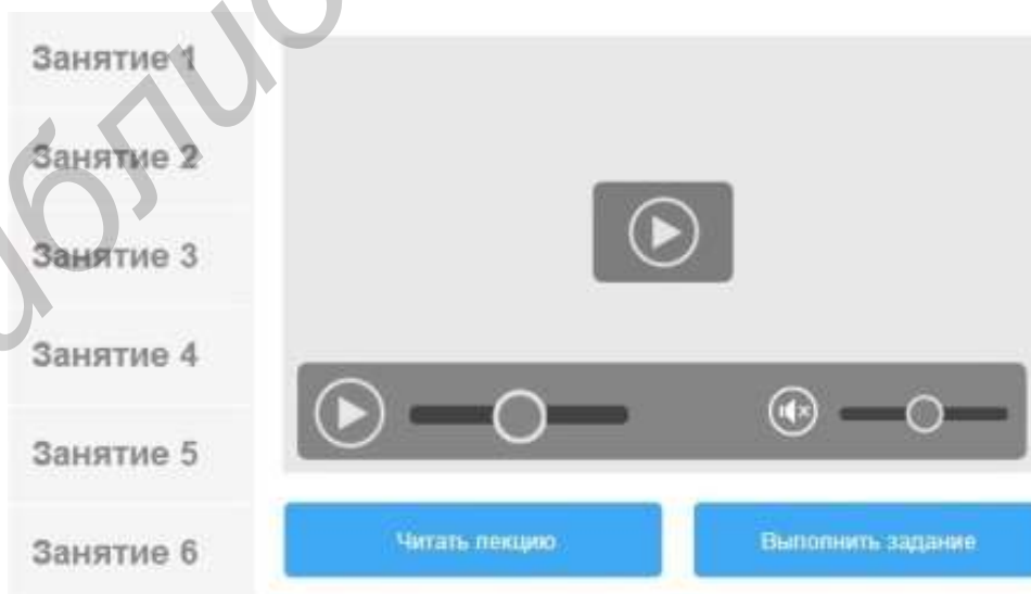
Рисунок 1 - Макет страницы учебного задания (лекции) мобильного приложения

В данной работе представлено описание прототипа разрабатываемого стандартизированного мобильного приложения для дистанционного обучения студентов с возможностью просмотра видео лекций, прочтения лекционных материалов, выполнения заданий для самостоятельной работы и обсуждения изученного материала. Также студенту предоставлена возможность контролировать с помощью мобильного приложения свой текущий прогресс в изучении каждого курса. Приложение предоставляет возможность загрузки всех необходимых материалов курса для дальнейшего ознакомления с ними в режиме отсутствия подключения к сети передачи данных.