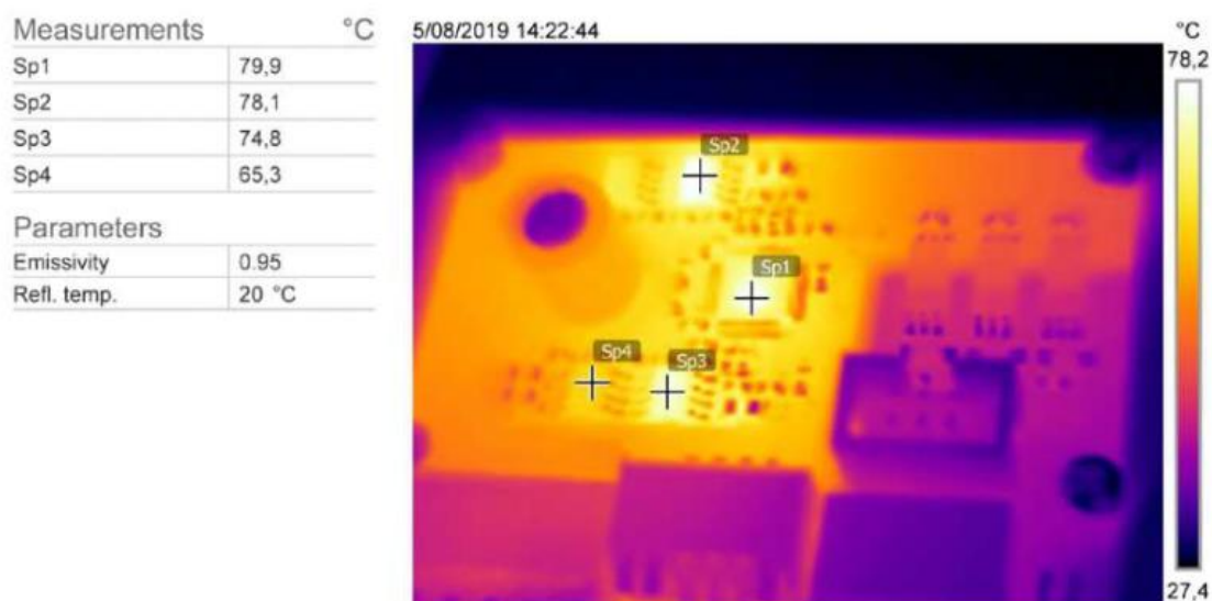
Рисунок 3 – Распределение тепловой энергии на плате с TMC2160-TA

Заключение. В ходе исследования проведён анализ устройства, а также установлено, что температура нагрева при нормальном режиме работы составляет 80 °C, что является приемлемо, а также имеет конфигурируемую защиту на случай перегрева. Исходя из анализа можно сделать вывод, что TMC2160-TA подходит для большинства современных задач в своей области, позволяя полностью контролировать движение механизмов с высокой точностью, вести мониторинг нагрузки и устранить ошибки движения из-за перегрузок, что делает драйвер очень надёжным, компактным и удобным устройством для конструирования мало-мощных механических устройств с плавным ходом и не требующих активного или пассивного охлаждения.