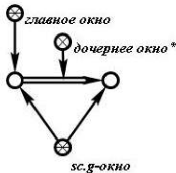
Рисунок 3 - Пример отношения дочернее окно*

Особенностью SCg-кода является то, что с его помощью можно отображать различного рода элементы управления, которые также являются частью базы знаний (семантической сети) и соответственно представляют собой знания, описанные с помощью SC-кода. Эти знания используются пользовательским интерфейсом для решения задач организации диалога пользователя с системой.