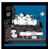
Рисунок 1 - Пример отображения sc.g-рамки

произвольного размера. Основным графическим языком является SCg-код. Окна отображаются с помощью SCg-кода в виде sc.g-рамок (рисунок 1)