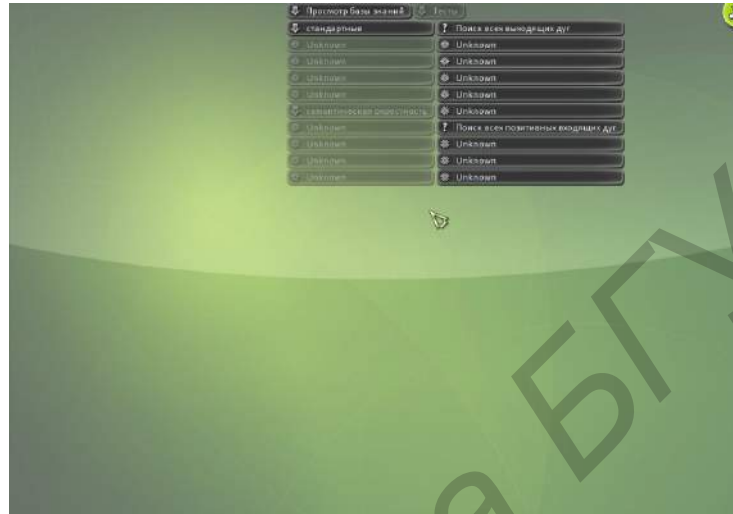
Рисунок 4 – Пример главного окна графического интерфейса.

Структура главного окна представлена на рисунке 4. В рамках этого окна имеется главное меню (на рисунке 4 изображено верхней части окна), которое состоит из отображения атомарных и неатомарных пользовательских команд (команда пользовательского интерфейса, при инициировании которой выводится ее декомпозиция* ).