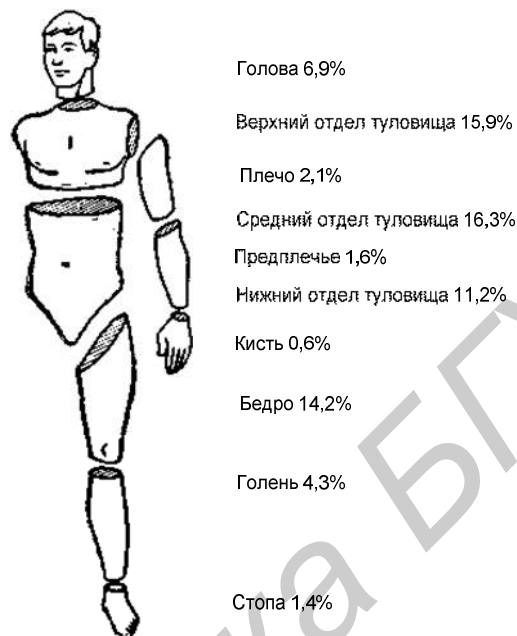
Рисунок 1- Распределение массы человека

Учёными биомеханиками были произведены исследования по определению массы и длины частей тела человека. В результате усреднения полученных результатов для взрослого мужчины получены данные, представленные на рисунке 1.