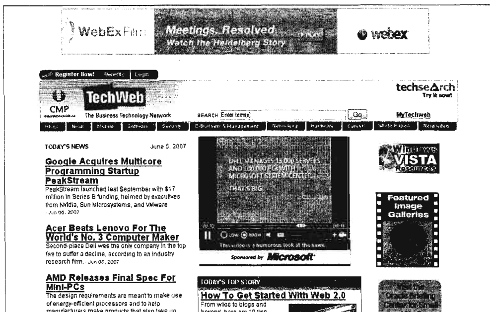
Рисунок 1 – Площадка для размещения баннерной рекламы

на корпоративный сайт www.itransition.com , то наиболее выгодно использовать рекламную площадку с наименьшей стоимостью за один переход (CPC), т.е. www.techweb.com . Поскольку разрабатываемый комплекс мероприятий нацелен именно на привлечение трафика на сайт, выбираем второй вариант – размещение баннера на месяц на www.techweb.com . Затраты на данную рекламную кампанию составят (56\ 790/1000) \cdot 156 = 8859,24 у.е.