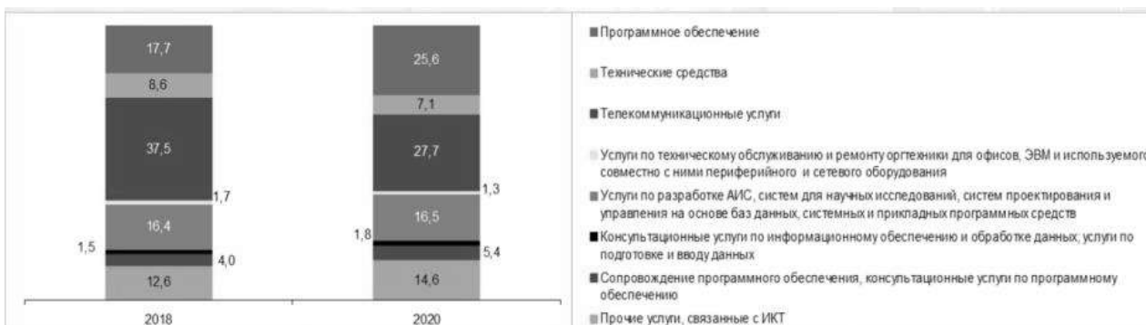
Рисунок 1 - Структура работ и услуг (в процентах к итогу) в секторе ИКТ

С каждым годом затраты предприятий на закупку и обслуживание программного обеспечения растут. На рисунке 1 показана структура работ и услуг (в процентах к итогу) в секторе ИКТ, оказанных за 2018 и 2020 год в Республике Беларусь по данным Белстат [1]. Отметим, что процент затрат на программное обеспечение в рассматриваемом периоде вырос в 1,5 раза.