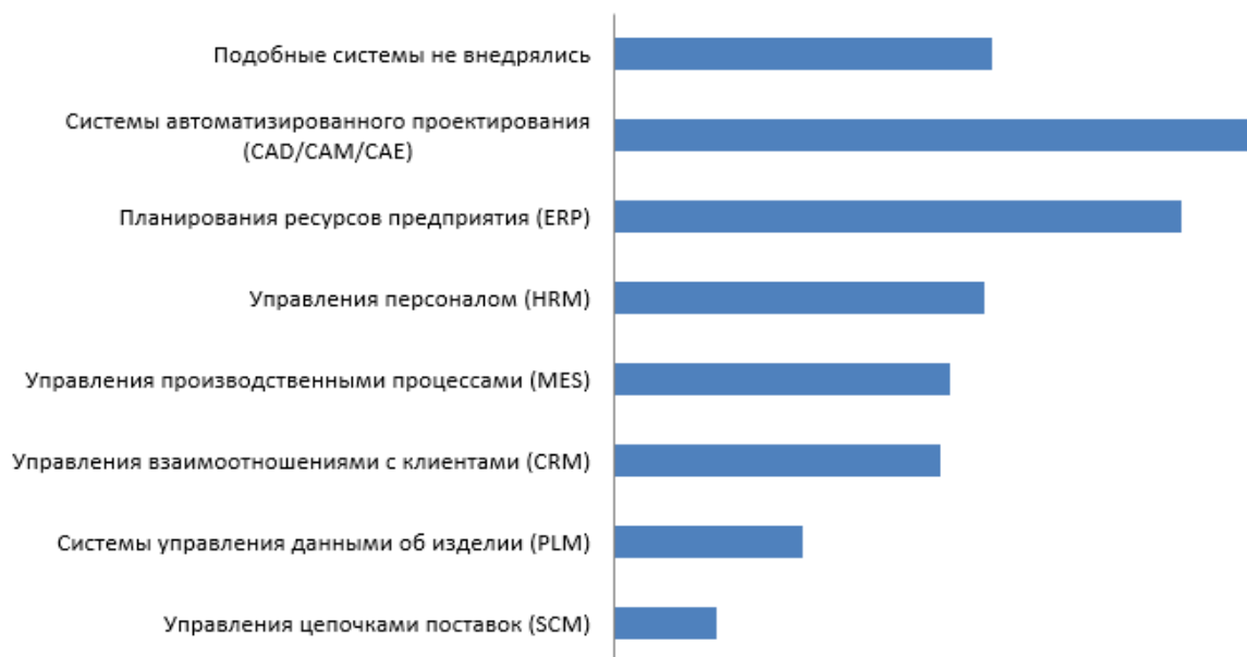
Рис. 1. Использование организациями информационных систем, автоматизирующих процессы учета, планирования и контроля, %