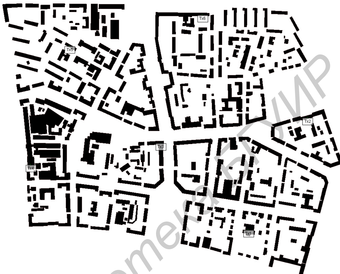
Рис. 1. Модель фрагмента городской застройки центральной части г. Минска с размещенными в нем шестью БС сети GSM-1800 (Тх1–Тх6).

наблюдения (АС) начинается в источнике излучения (БС) и продолжается, зеркально отражаясь от стенок зданий и земной поверхности не более заданного количества раз (данный параметр используется для отбора лучей, учитываемых при суммировании на входе приемника АС), дифрагируя на углах и краях крыш зданий.