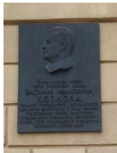
Рисунок 1 – Мемориальная доска в Минске по ул. Козлова д.13.