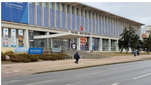
Рисунок 3 – Улица, названная в честь Василия Ивановича Козлова, г. Минск.

Умер Василий Иванович Козлов 2 декабря 1967 года. Похоронен в Минске на Восточном («Московском») кладбище.