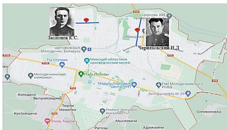
Рисунок 1 – Карта г. Молодечно, ул. Заслонова и Черняховского

Основная часть. Объектами нашего изучения стали биографии Черняховского И.Д., Заслонова К.С., Гастелло Н.Ф., Казея М.И. и история названия улиц Черняховского И.Д. и Заслонова К.С. в г. Молодечно (рисунок 1), а также улиц Гастелло Н.Ф. и Казея М.И. в г. Поставы (рисунок 2).