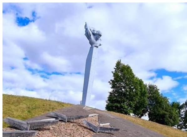
Рисунок 3 – Памятник экипажу Гастелло в Молодечненском районе. Фотография Лабыш И. В., июль 2021

В городе Поставы именем Гастелло Николая названа улица. Это небольшая улица с застройкой частными домами.