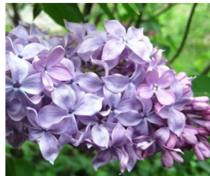
Рисунок 3 – Сирень обыкновенная «Вера Хоружая» в Ботаническом саду г. Минска

Жизнь-подвиг Веры Захаровны Хоружей навсегда сохранится в нашей белорусской истории. В честь подпольщицы названы улицы в Минске, Пинске, Витебске, Бобруйске, Бресте. В тех же городах ей установлены памятники (рисунок 1) и мемориальные доски. В бывшей тюрьме СД в городе Витебске находятся портреты Веры и ее товарищей по подпольной работе и памятник. Мемориальный знак и бюст в честь подпольщицы располагаются в ее родном городе – Бобруйске. Мемориальная доска – в Бресте на улице Буденного, д. 31. Герою Советского Союза Хоружей В.З. посвящены фильмы: «Письма в бессмертие» (режиссер-оператор Самуил Фрид, 1970 г.), «Письма к живым» (режиссер Валентин Виноградов, 1964 г.), а также 2-я симфония Кима Тесакова (1967 г., отредактирована в 1970 г.), книга «Вера Хоружая» (автор Иван Новиков, 1973 г.), почтовая марка (выпущена в 1964 г., рисунок 2) и даже сорт сирени в Ботаническом саду г. Минска (рисунок 3).