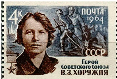
Рисунок 2 – Вера Хоружая на почтовой марке СССР, 1964 г.

В тюрьме товарищи заметили нездоровый вид девушки и сообщили об этом в ЦК КПЗБ. После переговоров 1932 года группу узников направили из Польши в СССР. Приехав