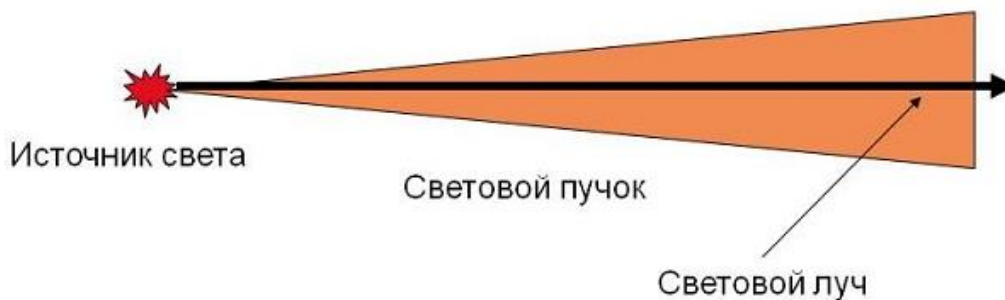
Рисунок 3 – Прямолинейное распространение света

Исходя из прямолинейного распространения света, выводятся многие понятия, такие как тень, угол падения и отражения, и многое другое. Разный раздел науки по-разному использует эти данные, но они имеют большое значение как в теории, так и в технике.