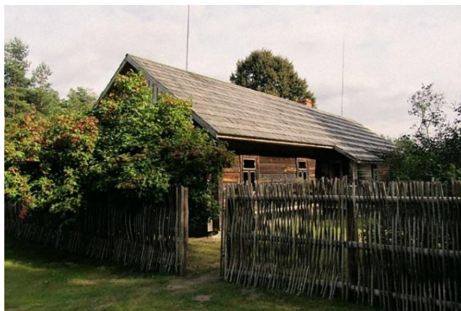
Рысунак 4 – Хата ў Смольні

Калі будавалася хата ў Смольні, Якуб Колас сядзеў у мінскай турме і толькі 19 верасня 1911 года прыехаў сюды ўпершыню. Беднай і запушчэлай здалася паэту Смольня. Каб хоць крыху зрабіць яе ўтульнай, Якуб Колас пасадзіў на сядзібе дрэвы. Ліпы, пасаджаныя ў яго першы прыезд, растуць і сёння. Пад гэтымі дрэвамі сядзелі маладыя Якуб Колас і Янка Купала ў час першай сустрэчы летам 1912 года.