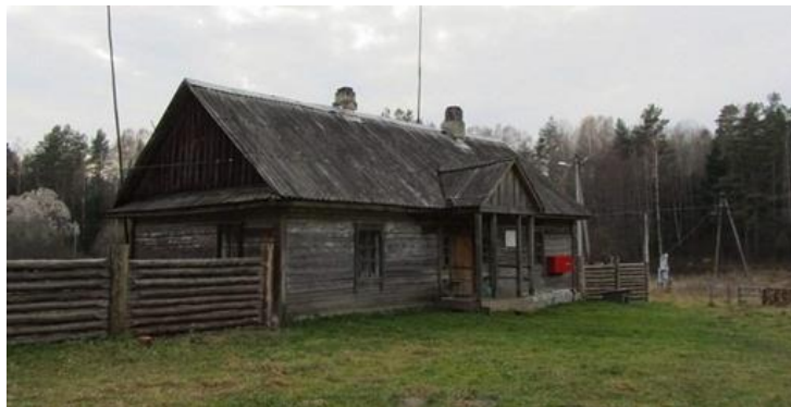
Рысунак 3 – Хутар Ласток

Набыта розная надоба; Ўсё зацвіло, загаманіла, Бы жыватворная тут сіла Ад сну прыроду абудзіла.