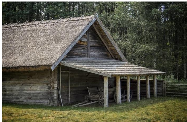
Рысунак 1 – Хутар Альбуць

Як пахне мёдам поле грэчак, Калі пачнуць яны цвісці!