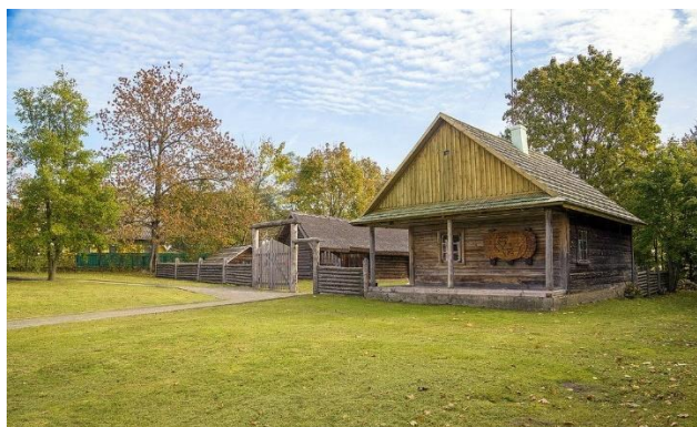
Рысунак 2 – Сяло Акінчыцы

Сяло Акінчыцы (рысунак 2) – не проста адна з вех на жыццёвым і творчым шляху песняра беларускай літаратуры Якуба Коласа. Гэта – яго калыска, тая самая маленькая радзіма, якая і падарыла нам будучага класіка ў далёкім 1882 годзе. Няхай яго сям'я і пражыла тут усяго чатыры месяцы, і няхай вёскі ўжо няма, – яна стала ўскраінай горада Стоўбцы, – але памяць пра гэту гістарычную падзею жыве і зараз.