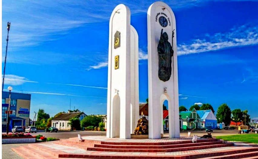
Рисунок 5 – Монумент «Единство четырех конфессий»

Затем у нас идет небольшой городок Ивье, ставший символом белорусской религиозной толерантности. Здесь установлен монумент «Единство четырех конфессий» (рисунок 5). Его открыли в 2012 году, и каждая из его сторон смотрит в сторону религиозного сооружения разных конфессий. С этого памятника можно начать осмотр города. А потом – посмотреть местную церковь, костел, мечеть и синагогу.