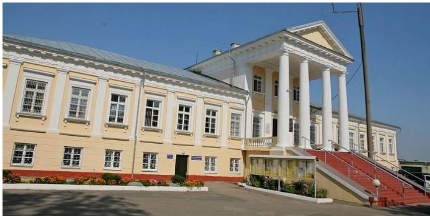
Рисунок 6 - дворцово-парковый ансамбль Тышкевичей

Далее едем в Воложин и знакомимся с Костелом святого Иосифа, а после – гуляем по дворцово-парковому ансамблю Тышкевичей, который был построен в 1803-1806 гг. по проекту архитектора Коссаковского (рисунок 6).