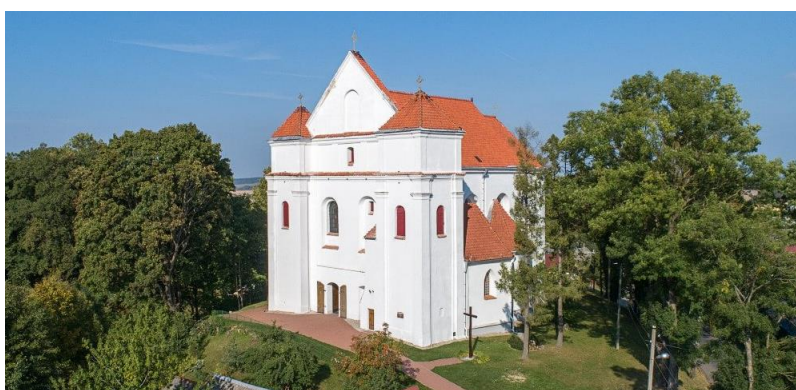
Рисунок 4 – Фарный костел Преображения Господнего

Далее мы отправляемся в Новогрудок. Это историческое место: первая столица ВКЛ, один из старейших городов страны. Здесь можно погулять по Замковой местности, сходить в дом-музей Адама Мицкевича. Доступны к посещению Борисоглебская церковь и Фарный костел Преображения Господнего, где были обвенчаны король Польши Владислав II (Ягайло) и княжна Софья Гольшанская (рисунок 4).