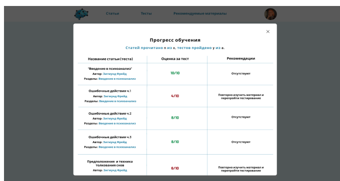
Рисунок 3 – Прогресс обучения

Приложение также будет содержать специальную страницу с рекомендуемыми материалами для самостоятельного изучения. Это позволит учащимся углубить свои знания в интересующих их темах, а также получить более полное представление о предмете изучения. На этой странице будут представлены полезные книги, научные статьи и другие