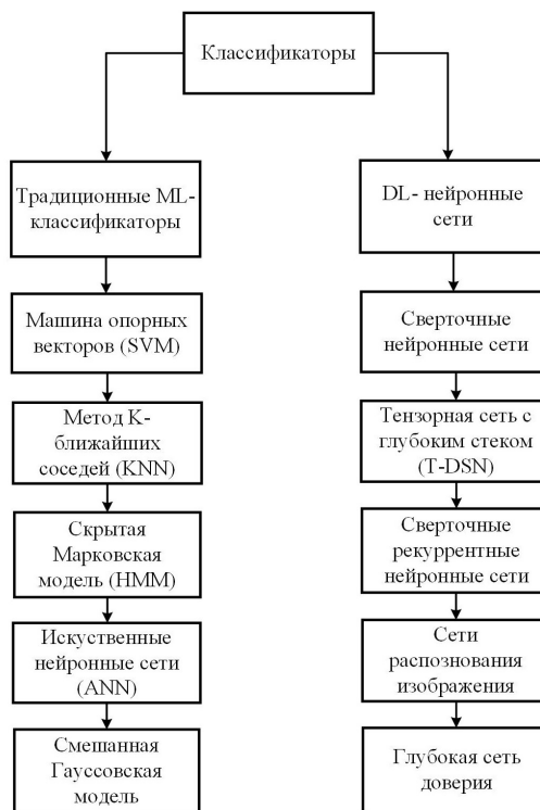
Рис. 3 – Классификаторы ML и DL

Основные типы классификаторов машинного обучения и глубоких нейронных сетей, используемые для решения задачи автоматической классификации звуков (рис. 3.)