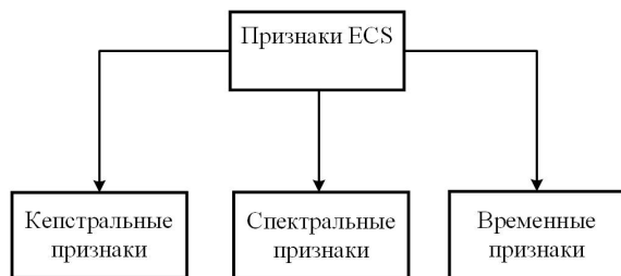
Рис. 2 – Категории классификации признаков ESC

Задача идентификации и классификации звуков окружающей среды является довольно сложной, поскольку данные типы звуков менее структурированы и полны шумов, чем другие типы аудиосигналов. Чтобы обеспечить эффективность работы классификатора, важно найти отличительное и информативное звуковое представление в качестве набора признаков и применить к нему задачу классификации с надежным алгоритмом и моделью.