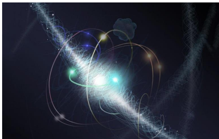
Рисунок 1 – Фотон и волна

Фотон не простая частица. Это маленький отрезок электромагнитной волны. Волны отличаются друг от друга энергией и длиной. Чем длиннее волна, тем меньше ее энергия. Фотоны (иначе их называют квантами) разных видов излучения – это отрезки волн различной длины (рисунок 1).