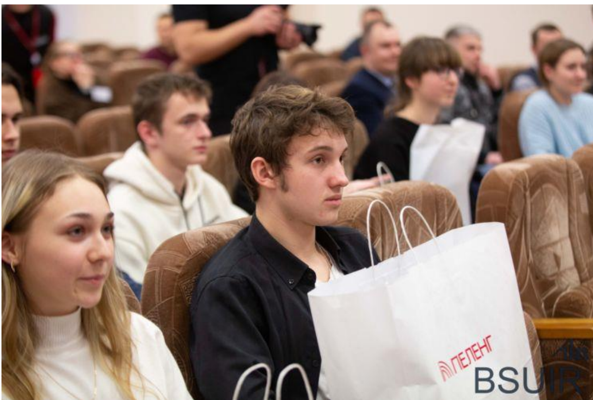
Подготовлено пресс-службой