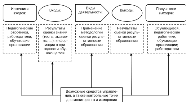
Рисунок 1 – Схематическое представление элементов отдельного процесса [3]

Стандарт провозглашает процессный подход, схематично показанный на рисунке 1.