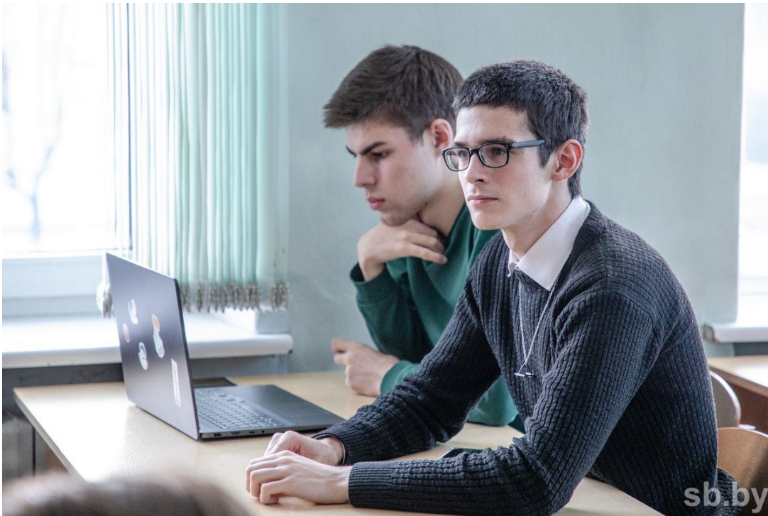
На лекцию пришли второкурсники БГУИР