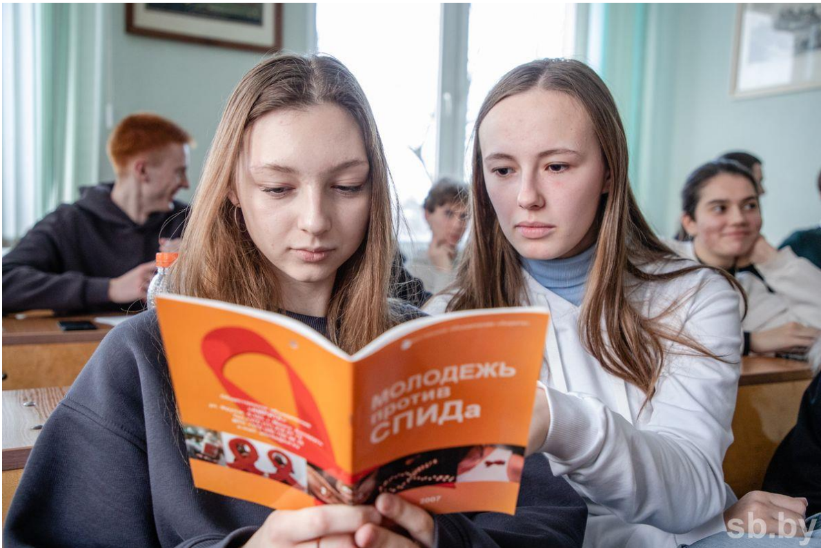
Молодежь против СПИДа, а вы?

Чтобы выявить вирус, нужно пройти специальный тест. Обнаружить его можно двумя способами – через кровь или через слюну, рассказывает эксперт: