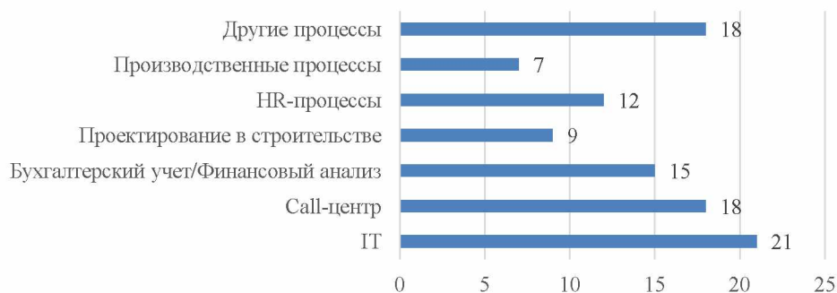
Рисунок 1 – Распределение видов бизнес-процессов, передаваемых на аутсорсинг в 2020 году, % Примечание: Источник – Собственная разработка с использованием данных Национального статистического комитета Республики Беларусь

2. В структуре аутсорсинга бизнес-процессов наибольший удельный вес занимают ИТ-услуги. В 2020 г. – около 21% (рис. 1):