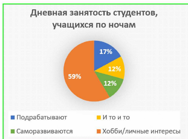
Рисунок 2 – Статистика по результатам опроса

Проанализировав результаты опроса, выявлено, что 41 студент из 84 учится по ночам. Их них 24 студента, днем уделяют время своим хобби/личным интересам и своим близким, 17 студентов тратят свое время днем на саморазвитие или подработку. Таким образом, студенты, указывающие на необходимость учиться по ночам, в приоритете для себя днем выбирают уделять время хобби/личным интересам, саморазвитию и в некоторых случаях подработке. Статистика по результатам опроса представлена на графике на рисунке 2.