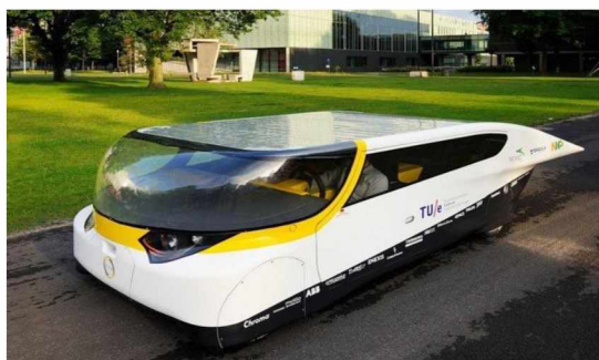
Рисунок 4 - Семейный автомобиль на солнечных батареях Stella

Stella — семейный автомобиль от Университета г. Эйнховен. Запас хода до 600 км, корпус из алюминия. Автомобиль рассчитан на четырех человек и имеет просторное багажное отделение. Габариты новинки: 4,5 м в длину и 1,65 м в ширину. Весит Stella всего 380 кг за счет использования в его конструкции алюминия и углеволокна [3]. Изобретение студентов нидерландского Технического университета Эйнховена представлено на рисунке 4.