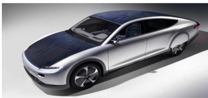
Рисунок 8 - Lightyear One

Lightyear One — автомобиль представлен в 2019 году. Фотоэлектрические панели площадью около пяти «квадратов» покрывают крышу и капот. Планируют сделать автомобиль с запасом хода до 725 км, зарядка от панели в течение 60 минут прибавит к ходу ещё 12 км [3]. Фото автомобиля Lightyear One представлено на рисунке 8.