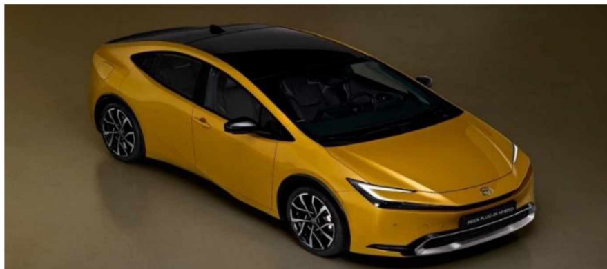
Рисунок 9 - Toyota Prius Prime 2023

У таких технологий действительно есть все шансы на будущее и серийное производство. Среди плюсов автомобилей с солнечными панелями можно выделить такие: