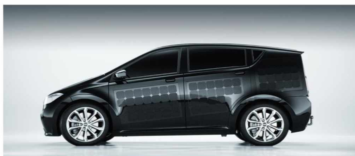
Рисунок 7 - «Солнечный» автомобиль Sono Motors Sion

Sono Motors Sion — немецкая разработка. Покрытые поликарбонатом панели на аппарате Sion обеспечивают машине «бесплатный» пробег до 30 км в день при хорошем освещении. Эту подзарядку разработчики назвали viSono. В этой модели система очистки воздуха из прядей островного мха, встроенных в приборную панель [3]. Фото автомобиля Sono Motors Sion представлено на рисунке 7.