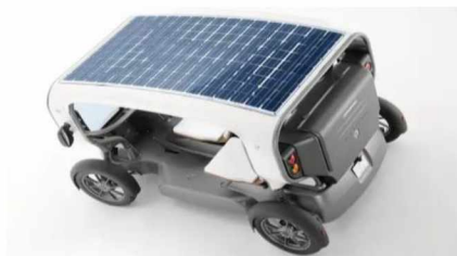
Рисунок 3 - Солнечные батареи на крыше_Venturi Eclectic

Stella — семейный автомобиль от Университета г. Эйнховен. Запас хода до 600 км, корпус из алюминия. Автомобиль рассчитан на четырех человек и имеет просторное багажное отделение. Габариты новинки: 4,5 м в длину и 1,65 м в ширину. Весит Stella всего 380 кг за счет использования в его конструкции алюминия и углеволокна [3]. Изобретение студентов нидерландского Технического университета Эйнховена представлено на рисунке 4.