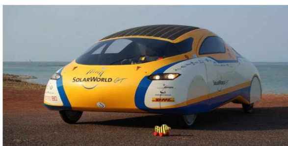
Рисунок 5 - Автомобиль SolarWorld GT

Автомобиль SolarWorld GT развивает максимальную скорость до 275,0 км/час, а время разгона до 100,0 км/час, составляет 4,0 секунды [2]. Чудо-батареи, реагирующие на солнечный свет, у SolarWorld GT расположены на крыше и на задней поверхности машины. Фото автомобиля SolarWorld GT представлено рисунке 5.