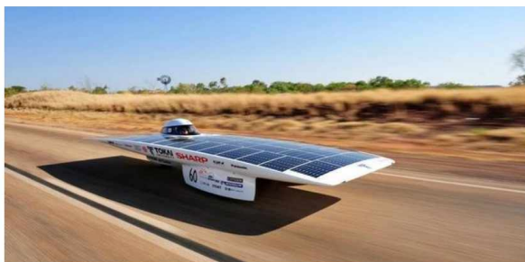
Рисунок 6 - Японский болид Tokai Challenger

Sono Motors Sion — немецкая разработка. Покрытые поликарбонатом панели на аппарате Sion обеспечивают машине «бесплатный» пробег до 30 км в день при хорошем освещении. Эту подзарядку разработчики назвали viSono. В этой модели система очистки воздуха из прядей островного мха, встроенных в приборную панель [3]. Фото автомобиля Sono Motors Sion представлено на рисунке 7.