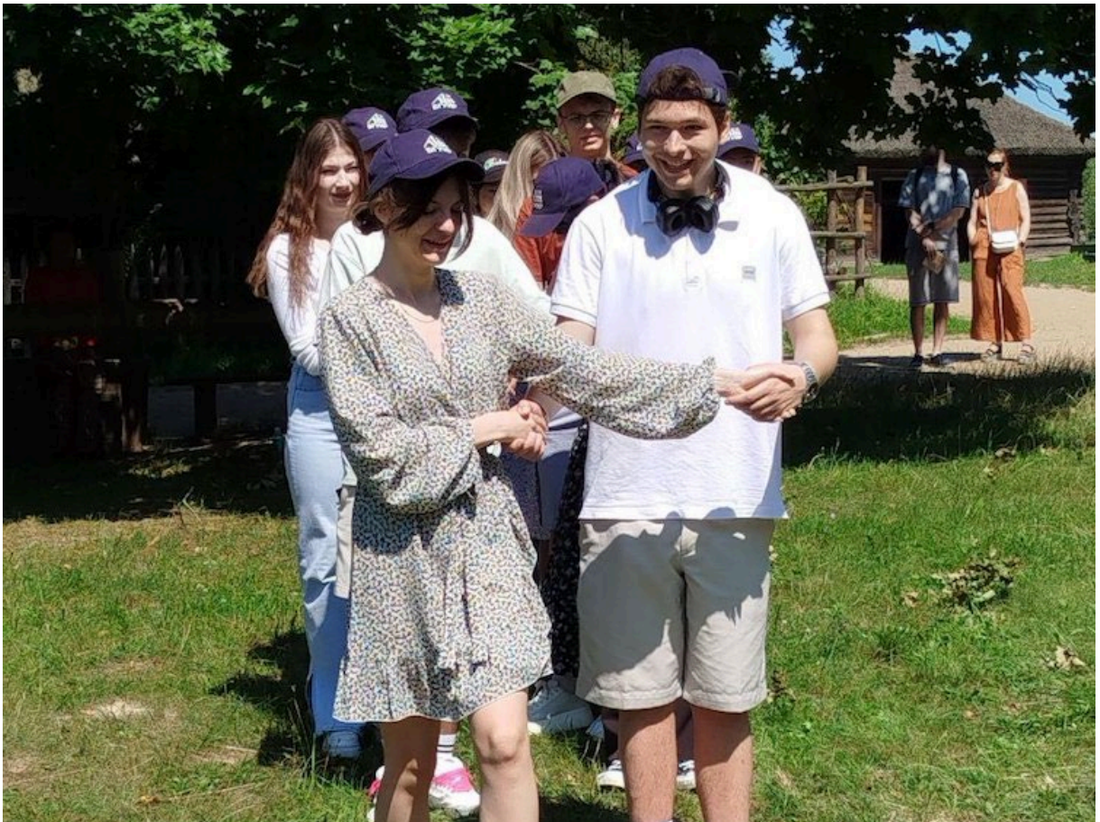
Подготовлено пресс-службой